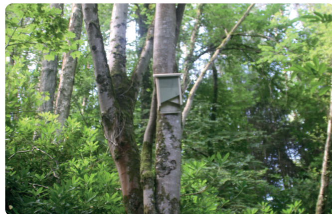
L'installation de nichoirs à oiseaux et chauves-souris fait partie des mesures compensatoires mises en place sur le site de Beauvoir.

Rien que sur le sujet de l'eau, la France, avec le plan lancé en 2023, est en pointe pour mettre en œuvre des réponses concrètes en matière de sobriété, disponibilité, qualité et réponse face aux crises de sécheresse. Les mesures de protection de ce plan s'appuient notamment sur un niveau de surveillance sans comparaison dans le monde. Comme le souligne Laure Fontaine, Vice-Présidente Environnement chez Imerys : « en France, plus de 3 000 points d'observation permettent d'évaluer l'empreinte de l'activité humaine sur l'eau , en quantité comme en qualité. À titre de comparaison, le Canada, 20 fois plus étendu que la France métropolitaine, ne dispose que de 300 points d'observation ».