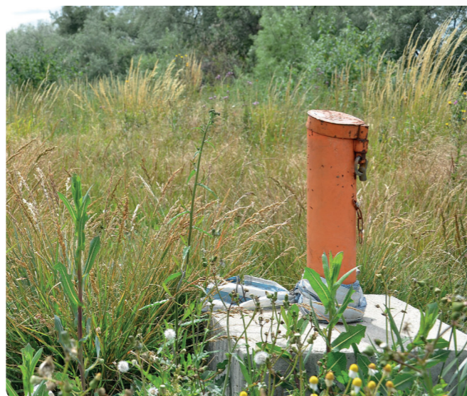
Le débit et le niveau des eaux souterraines sont suivis notamment grâce aux mesures fournies par des piézomètres.